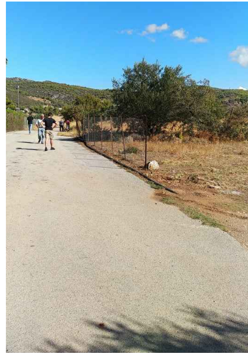
Φωτογραφία ιδιοκτησίας από την θέση Α4 προς την θέση Α9

ΥΠΕΥΘΥΝΗ ΔΗΛΩΣΗ ΜΗΧΑΝΙΚΟΥ (Ν.651/77, άρθρο 5, Ν.1337/83, Ν.4178/13, άρθρο 3, παρ.1α, Ν.4495/17, άρθρο 83, παρ.1)